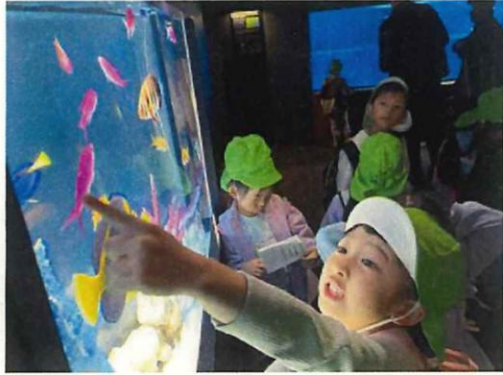
「ハナゴイだ!」「ピンクきれい!」