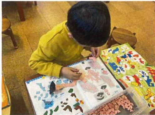
本を見ながらサンゴを作るのに夢中です。