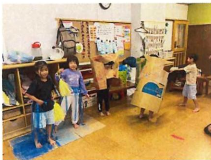
ホンソメワケベラが大好きになり、劇遊びもしました。