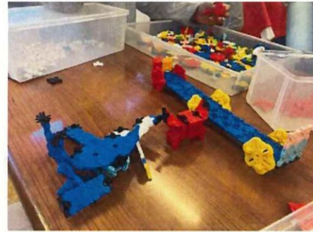
ハンマーヘッドシャーク・マンタ・カニ・船などを 作りました。