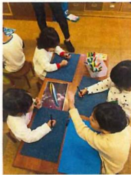
保育園に戻って水族館で見た様々な魚を思い出して、写真を見ながら絵を描きました。