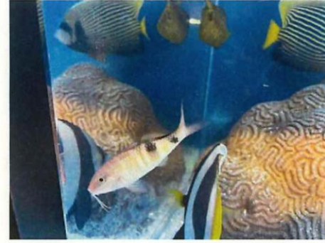
「オジサン!ヒゲはえてる!」「タテジマキンチャクダイ!これ大人だ!」