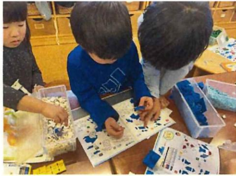
「もっと色々な魚（LaQで）作りたい！」「海の世界作りた い！」と様々な海の生き物を作っていました。