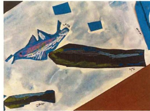
絵:オジサンを掃除しているホンソメワケベラ