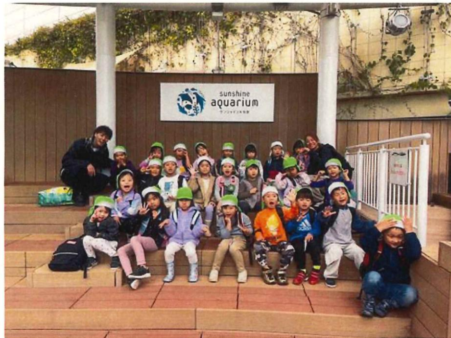
水族館に行ったことから様々な活動に広がりました。

ホンソメワケベラをどんどん知りたくなっていく子どもたち。水族館で様々な魚を見たことで、絵本に出てくるオジサン、ハナゴイ、ハリセンボン、タテジマキンチャクダイなどホンソメワケベラ以外の魚への関心も広がりとくさんの名前を覚え、図鑑で調べたり、絵を描いたり、LaQを作ったりして楽しんでいました。水族館に実際に見に行った後も気になることがあったので福音館の方に手紙を書いて質問をし、更に関心を深めました。