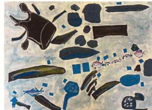
みんなの絵を合わせて海の世界の協同画が完成!!