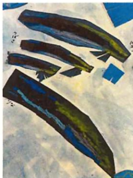
絵:ホンソメワケベラの家族