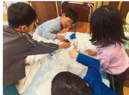
水色の布を探して、できたものから並べて海の世界 を作っていました。